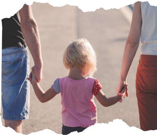
Nous, parents Avant 6 ans